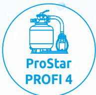
ProStar PROFI 4