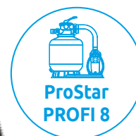
ProStar PROFI 8