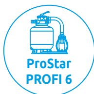
ProStar PROFI 6